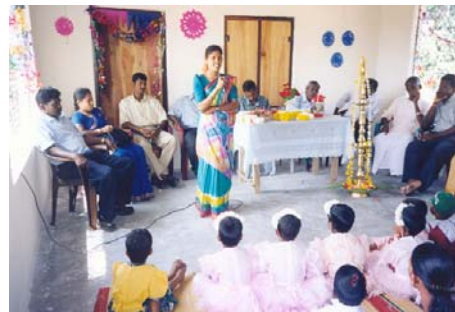
Feestelijke opening pre-school Ralkuli

De pre-schools in Kanthale en Ralkuli zijn in 2003 afgerond en volledig in gebruik genomen. Het beheer wordt uitgevoerd door EHED, de kleuterleidsters nemen periodiek deel aan scholingsprogramma's zodat zij op de hoogte blijven van de actuele leerprogramma's.