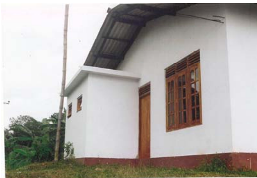
Het toiletgebouw aan de achterzijde van de Wanduramba pre-school

Nadat er uiteindelijk overeenstemming was kon de school in het voorjaar van 2004 afgebouwd worden, en na de zomervakanties ook daadwerkelijk in gebruik genomen worden. De rapportage van de ingebruikname hebben we helaas nog niet ontvangen.