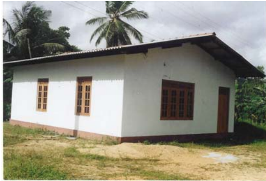
De nieuwe Wanduramba pre-school

doordat idereen volledig gericht was op het herstel van de schade na de overstromingen eind 2002, daarna doordat de geplande verplaatsing van de elektriciteitsmast alsmear niet uitgevoerd werd. De verplaatsing op zich was goedgekeurd, echter er was niemand die de kosten voor zijn rekening wilde nemen.