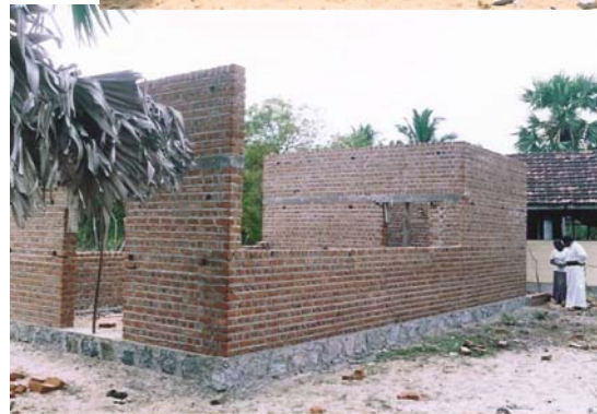
Pethalai pre-school in wording