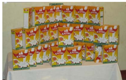
De pakken melkpoeder