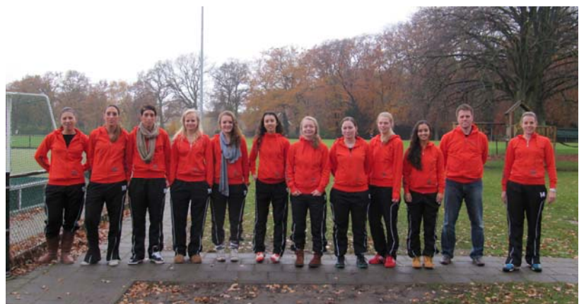
Dames 1 - team van Hockeyclub Prinses Wilhelmina