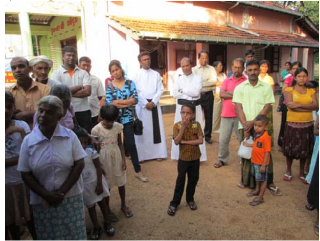
Klaar staan met een jerrycan in de hand. Voor deze mensen is schoon drinkwater bereikbaar.

Het zal u duidelijk zijn dat deze installatie de vraag niet aan kan en dat er behoefte is aan transport van dit verantwoorde water. Er zou nog minstens zo'n installatie bij moeten komen, prijs 16 duizend euro. De watermonsters van het vervuilde water zijn door ons meegenomen en zullen binnenkort wetenschappelijk in ons land worden onderzocht. Natuurlijk hoor ik u denken waarom de overheid niets doet aan zo'n kwestie. Het is al jaren bekend en het is al eens eerder onder de aandacht van de overheid gebracht, maar ondertussen zijn er wel beloften, de praktijk leert dat er ondertussen jaren voorbij gaan en er niets gebeurt. Via internet heb ik gevonden wat de oorzaak zou kunnen zijn, welke stof in drinkwater deze verschijnselen kan geven. Laten we het onderzoek maar afwachten, maar ik zie het donker in voor hen die aangetast zijn.