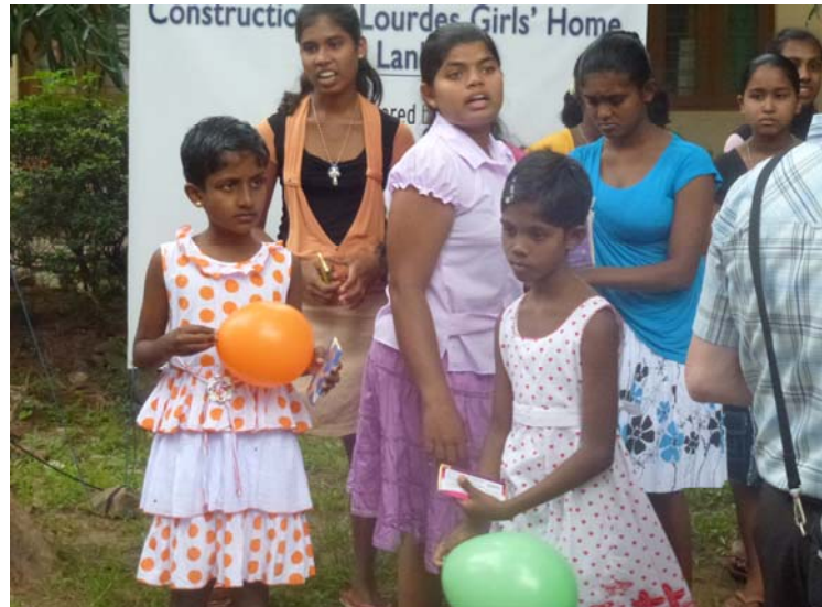
De kinderen die nu in het oude huis wonen

Een aantal delen van het bejaardenhuis te Kandy zijn inmiddels gesloopt en vernieuwd, het hospice is inmiddels in gebruik genomen. In dit ouderencentrum zijn wij bezig de keuken te vernieuwen en de eetzaal te vergroten, waarschijnlijk is dit klaar in de zomer van dit jaar. Persoonlijk heb ik tussendoor nog een aantal financieel ondersteunden, thuis bezocht. De verhalen van allen zijn zorgvuldig opgetekend en foto's zo goed mogelijk gemaakt en pakketjes en brieven werden uitgewisseld.