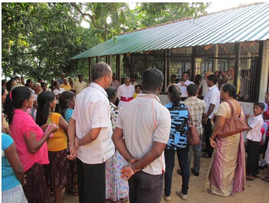
12 Januari 2013: Opening van waterzuivering in Solepura