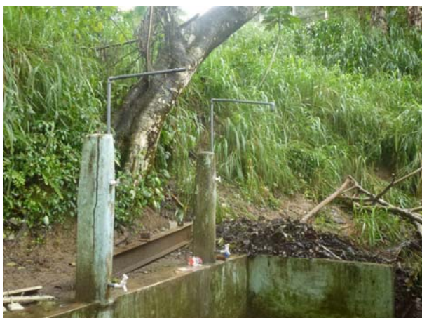
De boom vernietigde het dak van de douches.

Wij hebben een bezoek gebracht aan een weeshuis voor jongens in Kandy. Ik ben vreselijk geschrokken van de situatie aldaar. Een reus van een boom was recentelijk tijdens het noodweer op het weeshuis gevallen en heeft de toiletten en douches vernield. Er wonen zo'n dertig jongens in de leeftijd van 8 tot 17 jaar, de sfeer was heel vriendelijk en gastvrij. De aanwezige pastor deed natuurlijk zijn uiterste best om hulp te krijgen, omdat hij al nauwelijks in staat is de jongeren voldoende eten te geven en een fatsoenlijke plek om te slapen te bieden. Ik heb in ieder geval het verhaal van één van de jongste kinderen meegenomen, zodat er in ieder geval een definitief contact ontstaat. Je kunt van alles willen maar er moet ook geld voor zijn!