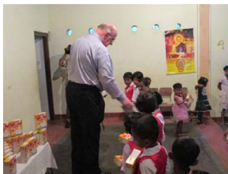
Melkpoeder uitdelen aan de kinderen Met schoon drinkwater erbij drinken ze elke dag verse melk.

Het zal u duidelijk zijn dat deze installatie de vraag niet aan kan en dat er behoefte is aan transport van dit verantwoorde water. Er zou nog minstens zo'n installatie bij moeten komen, prijs 16 duizend euro. De watermonsters van het vervuilde water zijn door ons meegenomen en zullen binnenkort wetenschappelijk in ons land worden onderzocht. Natuurlijk hoor ik u denken waarom de overheid niets doet aan zo'n kwestie. Het is al jaren bekend en het is al eens eerder onder de aandacht van de overheid gebracht, maar ondertussen zijn er wel beloften, de praktijk leert dat er ondertussen jaren voorbij gaan en er niets gebeurt. Via internet heb ik gevonden wat de oorzaak zou kunnen zijn, welke stof in drinkwater deze verschijnselen kan geven. Laten we het onderzoek maar afwachten, maar ik zie het donker in voor hen die aangetast zijn.