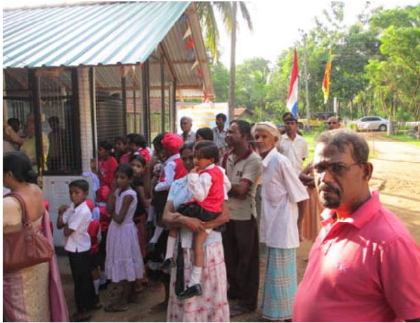
De bevolking van Solepura bij het gebouw waarin het water gezuiverd wordt.

Er is echter een probleem dat allen raakt, het drinkwater is (naar alle waarschijnlijkheid) door langdurig gebruik van bestrijdingsmiddelen en overbemesting ernstig vervuild geraakt. Ik heb daar mensen gezien van vijftig, die er als zeventig jarigen uitzien. Er zijn veel mensen met nierproblemen, pijnlijke botten, tanden en kiezen die uitvallen en mensen die slecht zien. Een slokje drinkwater van een pomp in het noorden van dit gebied, proefde ik na uren nog in mijn mond. De tragedie vond ik ook de kinderen, die bruine tanden hebben of tanden met vreemde bruine vlekken en stippen. Je voelt al aan, dat dit blijvend is en een voorteken van een slechte gezondheid en een aantasting voor het leven. Van oorsprong ben ik verpleegkundige en kijk je ook met andere ogen naar al die kinderen met hun bruine tanden, ook al kijken ze je nog zo lachend en stralend aan. Er werd door deze Father met behulp van onze stichting een grote zuiveringsinstallatie gebouwd. Deze installatie biedt honderden liters schoon en verantwoord drinkwater per dag.