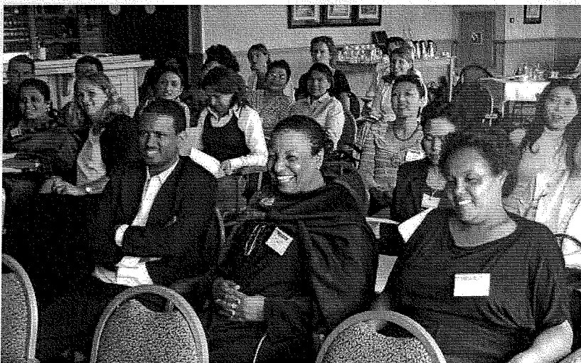
Contactpersonen kwamen vanuit de hele wereld over voor een week vol workshops en debatten, en natuurlijk voor de Wereldkinderendag!

Typerend overigens dat de aspirant-adoptieouders vaak benoemd worden als vraagkant en de kinderen als het aanbod. Vanuit het belang van het kind geredeneerd vormen de kinderen juist de vraag. Het kind heeft een behoefte en vraagt om een thuis. Wereldkinderen heeft als uitgangspunt dat eerst wordt gekeken naar de mogelijkheden voor een binnenlandse adoptie. Veel ouders geven aan dat juist deze visie meespeelt