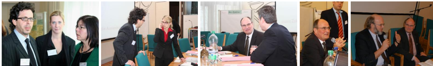
6. Tagung der Bundeszentralstelle für Auslandsadoption mit den zentralen Adoptionsstellen der Landesjugendämter und den zugelassenen Auslandsvermittlungsstellen in Zusammenarbeit mit dem Bundesministerium der Justiz vom 4. bis 5. März 2009 im Welsaal des Auswärtigen Amtes