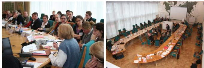
6. Tagung der Bundeszentralstelle für Auslandsadoption mit den zentralen Adoptionsstellen der Landesjugendämter und den zugelassenen Auslandsvermittlungsstellen in Zusammenarbeit mit dem Bundesministerium der Justiz vom 4. bis 5. März 2009 im Welsaal des Auswärtigen Amtes

Das Verschicken von Listen wird abgelehnt, weil es ein Eindruck von „merchandise“ (Handel) erweckt.