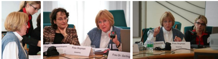
6. Tagung der Bundeszentralstelle für Auslandsadoption mit den zentralen Adoptionsstellen der Landesjugendämter und den zugelassenen Auslandsvermittlungsstellen in Zusammenarbeit mit dem Bundesministerium der Justiz vom 4. bis 5. März 2009 im Weltsaal des Auswärtigen Amtes

We acknowledge the rules of the Hague Convention, without which we would not have been able to provide a service as we have done over the years, until the promulgation of our new Children's Act. For us the rules have been sufficient, and I believe by following that one can ensure that children are safely placed, and that should be our main aim in inter country adoptions, ensuring that the best interest of the child is served when the child is adopted by a family, and nothing else.