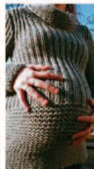
Elle parle à sa vraie mère.

Pour les enfants « nés sous X », l'abandon est une déchirure qui peut durer toute une vie. Une adoption réussie occulte parfois ce sentiment, mais le traumatisme est fonction de l'identité de l'enfant et des conditions de l'abandon. « Nous avons été adoptés, ma sœur et moi, nées de parents biologiques différents, et nos parents nous l'ont expliqué avant même que nous soyons en âge de comprendre. Cela ne m'a posé aucun problème jusqu'à l'âge de 15 ans », explique une jeune Liégeoise.